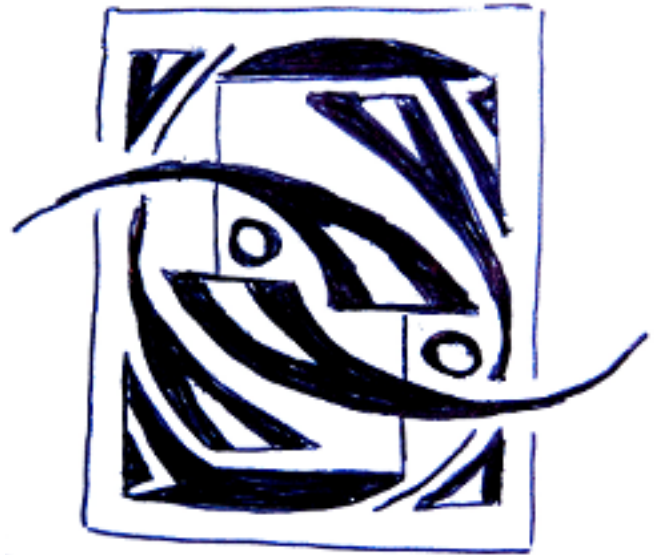
le cœur à plein le corps

le corps à pleins mots le cœur et pas seulement peut-on l'âge à la fois le trouble et l'adieu que craindre de ne pas tenir ?