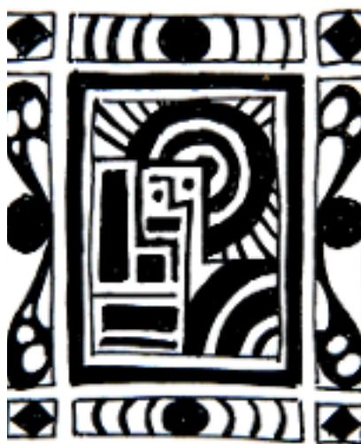
nos petits doutes derrière

ici on bricole nos petits doutes on les cache derrière des lunettes noires des écharpes des bijoux des voyages du sport des armes du maquillage du cynisme et des faux-semblants alors que quelque part dans le monde des pauvres gens s'interdisent le doute